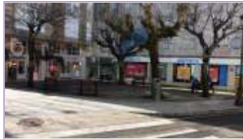
Praza de Pacual Veigar