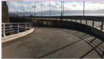
Mirador Praza do Mar