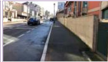
Mirador Praia da Carabueira