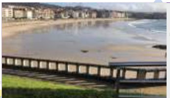
Mirador Praia Silgar