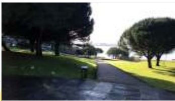
Mirador Praia Baltar