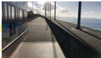
Mirador Avenida do Porto