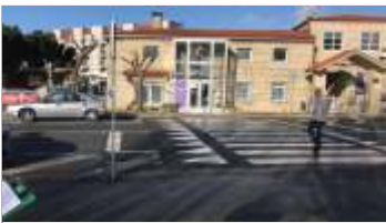
CIM DE Sanxenxo