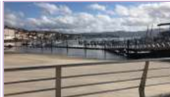
Mirador Praza dos Barcos