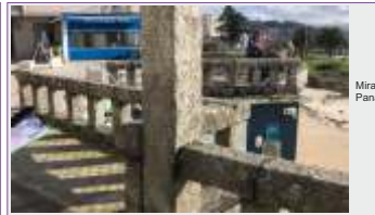
Mirador Praia de Panadeira