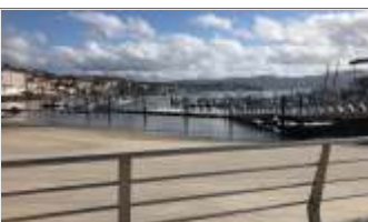
Urania Mella Serrano