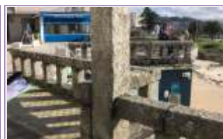
María Luz Morales