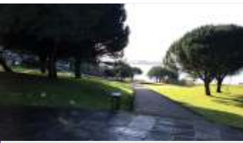
Rosalía de Castro