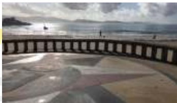
Mirador Rosa dos Ventos