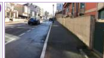
Emilia Pardo Bazán