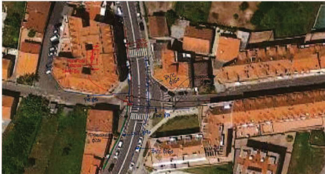
Red de abastecimiento