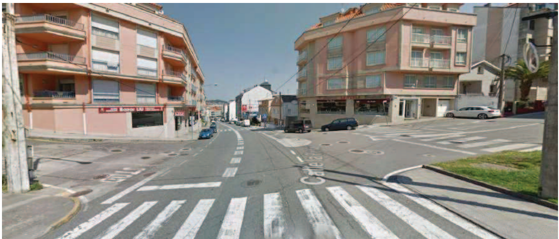
Estado actual de la intersección