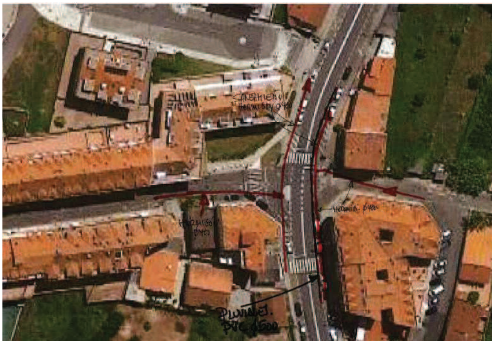
Red de saneamiento y pluviales

Se advierte en el trazado de abastecimiento, la existencia de un tramo de conducción en fibrocemento de Ø200mm, que en la nueva actuación quedará bajo el carril de la rotonda, por lo que el concello deberá de tomar las medidas oportunas para evitar roturas durante las obras y el posterior uso de la intersección en rotonda.