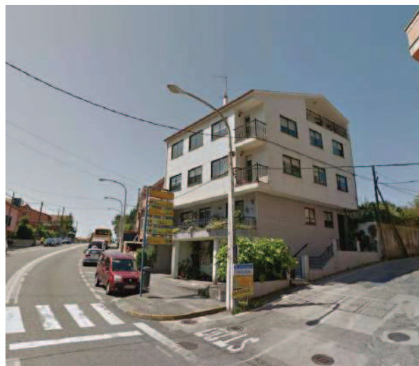
Farola y poste a desplazar en C/Catadoiro