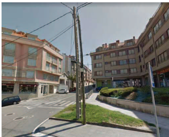
Dos postes a desplazar en C/La perla