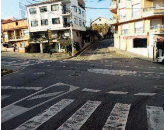
Vista hacia calle Catadoiro