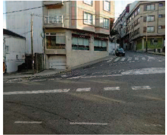
Vista hacia calle La Perla